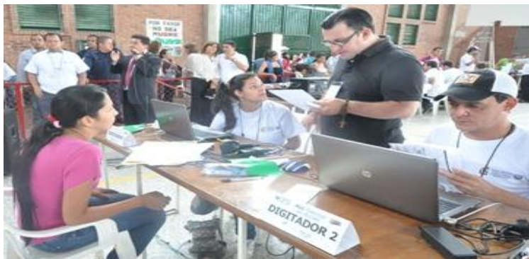
Programa 'Familias en Acción Más' abrió periodo de inscripciones